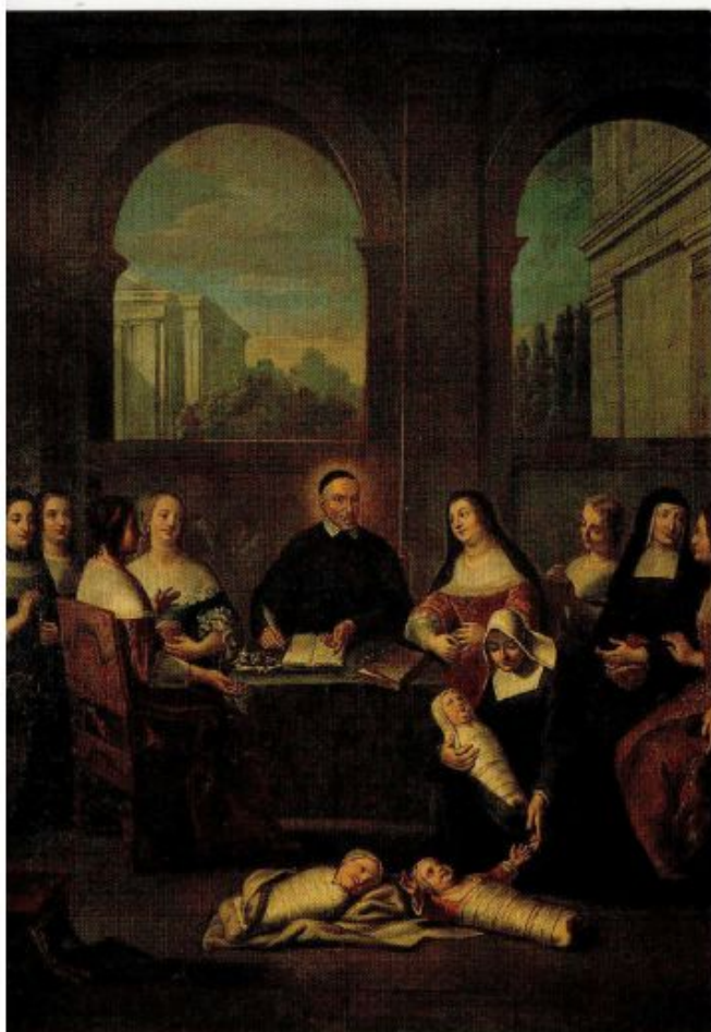
Ci-dessus : Saint Vincent de Paul et les Dames de la Charité, peinture attribuée à Frère André, vers 1730

Aujourd'hui, ce bâtiment est encore occupé par un centre d'accueil d'urgence.