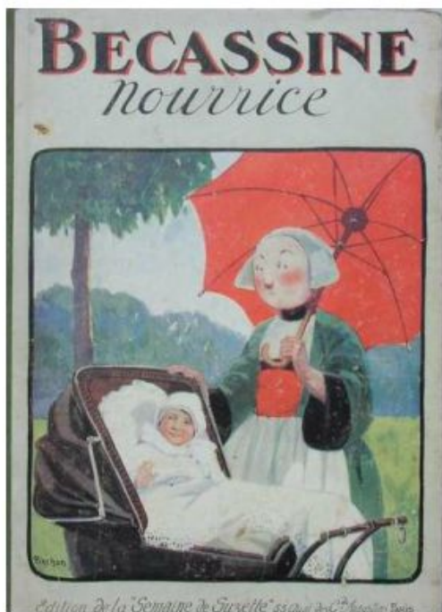
C Gautier-Languereau 1922 Pinchon / Caumery

Quelle idée saugrenue riposteront courroucés les quelques Bretons (y en aura-t-il ?) qui auront l'heur de lire ces quelques lignes. Bretonne est Bécassine et elle le restera. Quelle imposture ! Regardez-la ! Une bouille ronde, réjouie ; yeux et nez également ronds ; robe de feutrine verte et plastron rouge ; un tablier blanc couvrant sagement l'ensemble. L'habit signe le terroir... Et pourtant... Me promenant une fois de plus dans un joli bourg du bord de Loire un jour de brocante, mon regard fut attiré par un album des années 30 des Editions Gautier-Languereau au titre combien incitatif à la lecture quand on est morvandelle : « Bécassine Nourrice ». Je savais que ce personnage si connu de bandes dessinées avait fait cent métiers, était allée chez les Turcs, s'était essayée à l'alpinisme, avait même été maîtresse d'école prouvant ainsi au monde entier qu'elle n'était pas aussi bécasse que cela ;