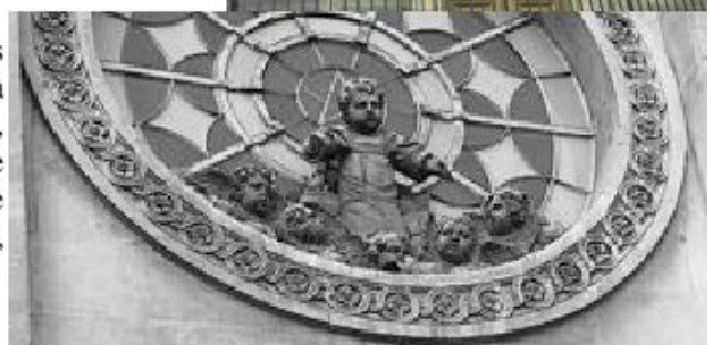
Ci-dessus : Photo de la façade de l'église et détail du groupe sculptural.

En 1814, l'hospice devint, « l'Hospice des Enfants trouvés » puis « l'Hospice des Enfants assistés » jusqu'en 1942 où il prit le nom d'Hôpital St Vincent de Paul, en hommage à Vincent de Paul, qui créa, avec les Dames de la Charité, une œuvre d'assistance aux enfants trouvés dès 1638.