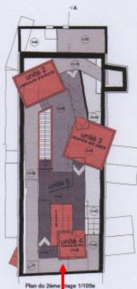
Plan du 2 ème étage